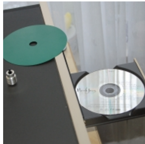
Dem Player verhalf die grüne SID-Matte von Peter Boffin zu noch mehr Musikalität. Eine minimale Verbesserung brachte auch der Zero Plug

Ein Umgestalten des Raumes kommt vor dem absehbaren Umzug nicht mehr in Frage. Trotz der zum Teil pragmatisch behobenen Widrigkeiten der Abhörsituation tönte das Ganze durchaus ansprechend. Die stärkste Verbesserung war bereits im Vorfeld durch ein Upgrade im Hochtonbereich erzielt worden, denn Newtronics-Chef Harald Hecken hatte den Lautsprechern neue Hochtöner nachgerüstet (s. Kasten). Ein weiterer Schritt war die etwas zurückgenommene Einwinkelung, die uns zu extrem schien. Da die Kabel für beide Kanäle sehr unterschiedlich lang sind, konnten wir auch hier nicht viel probieren. Deshalb war in diesem Fall eine Politik der kleineren Schritte angesagt. Das mechanische Brummen des Tuners ließ sich mit Sorbothan-RDC 4-Kegeln von Clearlight Audio vermindern. Eine marginale Verbesserung in Richtung Straffheit und Beruhigung der Stimme von Norah Jones erzielte ein Zero Plug von Black Forest Audio im Digitalausgang des DP-77 (25 Euro). Weitaus größer fiel zur allgemeinen Verblüffung die feiner gestaffelte Raumabbildung und bessere Durchzeichnung im ganzen Frequenzspektrum sowie die Ruhe im Klangbild, vor allem in Stimmen, auf, die durch verschiedene CD-Matten