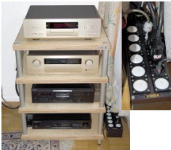
Tragendes und durchaus ein den Klang erheblich mitbestimmendes Element der Anlage ist das Reaktiv-Rack „Little Reference“