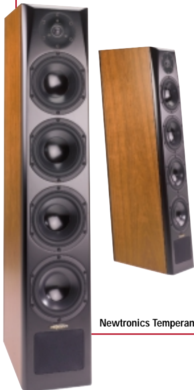
Newtronics Temperance III

Newtronics rüstet sein Passiv-Flaggschiff nochmals auf